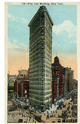
New York City Le Flat Iron Building