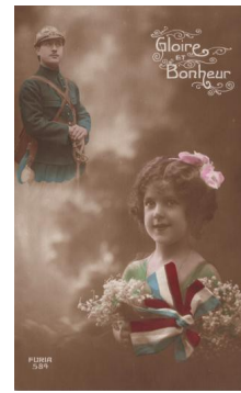
Gloire et bonheur » : la petite pensant à son père parti au front, carte patriotique de la Guerre de 14