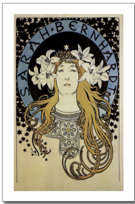
Sarah Bernhardt, par Alfons Mucha