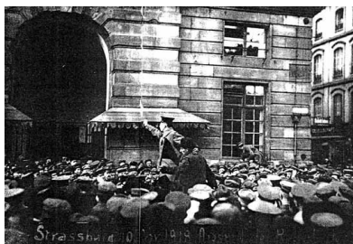
La révolution à Strasbourg, novembre 1918