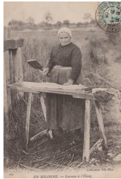
Les petits métiers de la France d'autrefois En Sologne : Laveuse à l'étang.